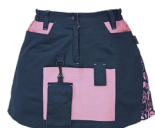
39 tmavě modrá-fialová