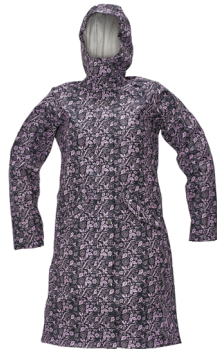
39 fialová-tmavě modrá