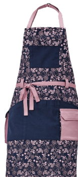
39 fialová-tmavě modrá