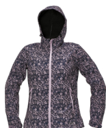
38 fialová-tmavě modrá