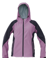
38 fialová-tmavě modrá