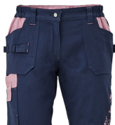
39 tmavě modrá-fialová