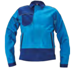
B2 modrá-tm. modrá