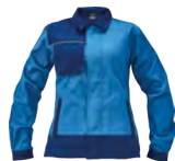
B2 modrá-tm. modrá