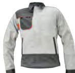
G6 sivá-tm. sivá