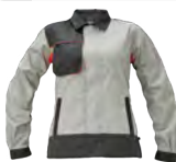
G6 sivá-tm. sivá